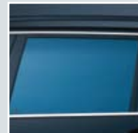
saphir dunkel 3AF sr