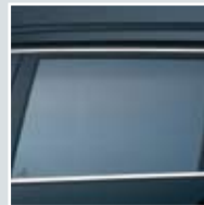
granit medium 35AF sr