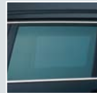
achat medium 30AF sr